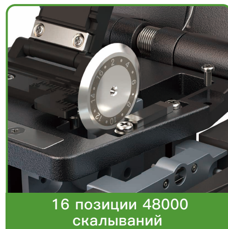
16 позиции 48000 скальваний